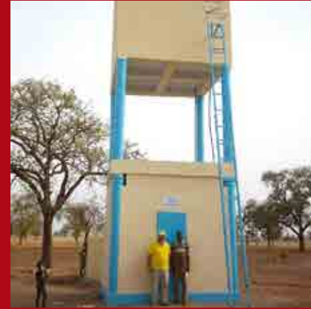
«Château d'eau construit à Ogara, Togo»